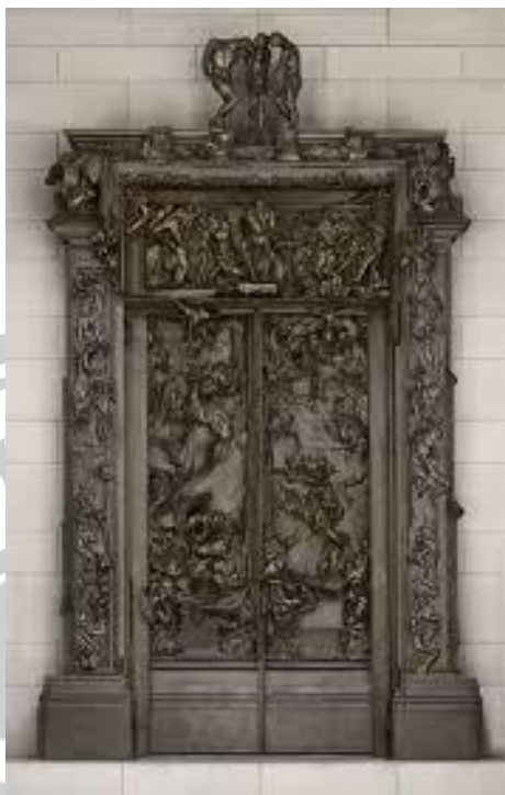
3-rasm. « Do'zax eshiklari »

Bu asari “Vorota ada” (“Do'zax eshiklari”) bitira olmadi. Bu asari xaykaltaroshni vafotidan so'ng bronza bilan quyilgan. 7 metrlik “Do'zox eshiklari” 186 ta figurani o'z ichiga oladi. Ularning asari aksariyati “O'tkinchi sevgi”, “O'pish” shuningdek “Odam” va “momohavo” kompozitsiyalarini alohida haykallari ham ishlagan. Rodenning eng mashxur asari va jahon tarixdagi eng taniqli xaykaltaroshlik obrazlaridan biriga aylangan “Mislitel” (“Fikrlovchi”).