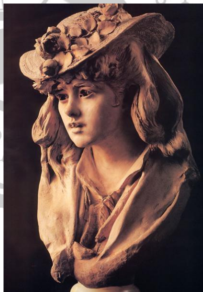
1-rasm. «Gulli qalpoqli qiz»