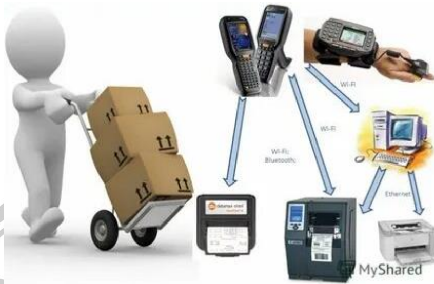
2-rasm. Maxsulotni maxsus yorliq orqali hisobini yuritish

Shuningdek, bunday ishlarning ro'yxati korxonada ma'lumotlarining muntazam zaxira nusxasini o'z ichiga oladi. Avtomatlashtirish dasturi bu ko'p funktsional axborot tizimidir. U vaqti-vaqti bilan biron joyga ko'chirilishi kerak bo'lgan juda ko'p ma'lumotlarni o'z ichiga oladi. Korxonada ombori ishini avtomatlashtirishda yangi yo'nalish bazasi bo'yicha avtomatik ravishda tarqatish bilan tashqi hujjatlardan ma'lumotlarni avtomatlashtirish dasturiga uzatishni ta'minlaydigan import funksiyasidan foydalanish taklif etiladi. O'tkazilgan